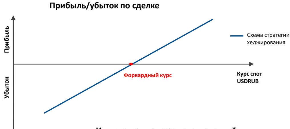
Индикативные параметры сделки*