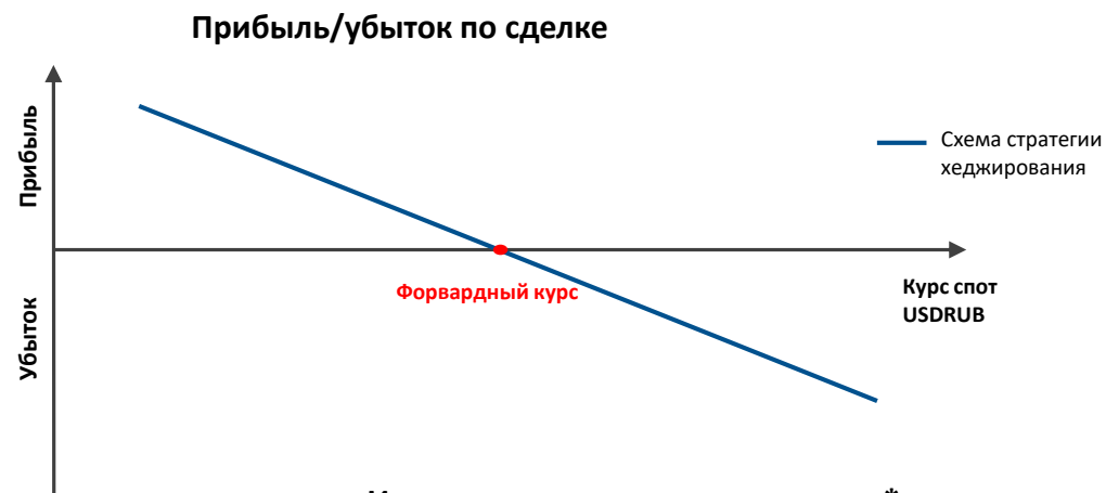
Индикативные параметры сделки*